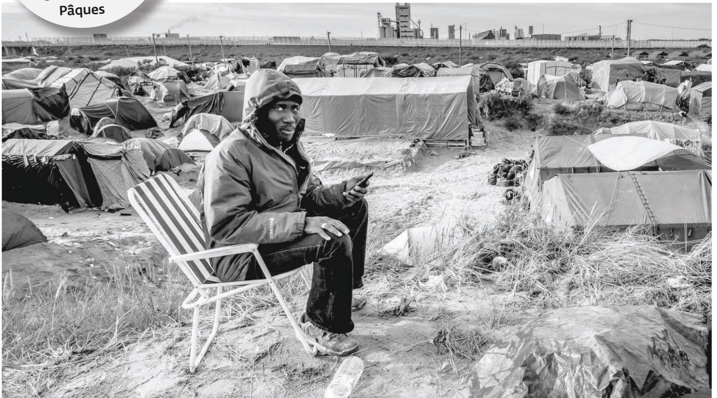
Environ 4500 migrants vivent dans le camp de la « Jungle » à Calais, dans des conditions très précaires.

JOURNAL DE LA PAROISSE RÉFORMÉE DE BIENNE