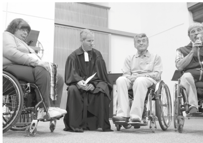
Des beaux moments de partage lors du culte d'ouverture du catéchisme du mois d'août 2015.