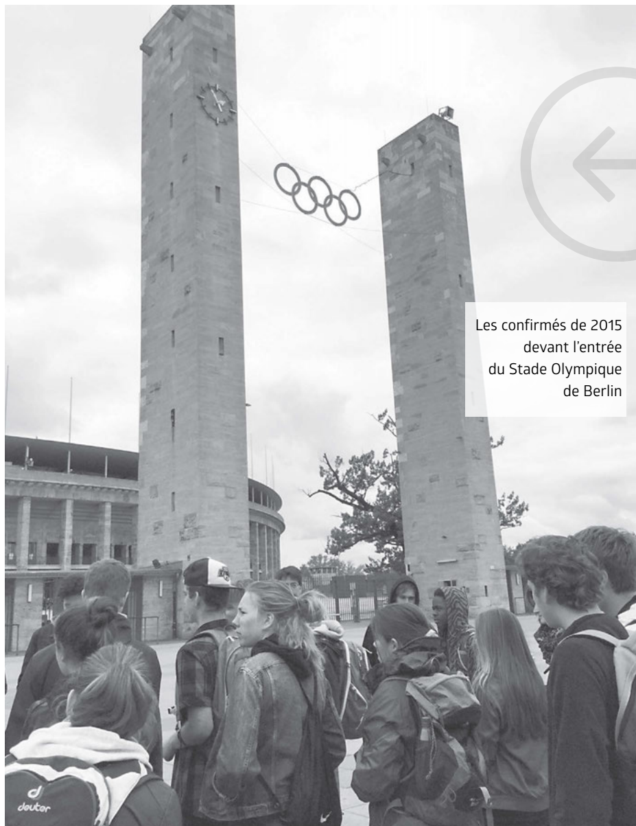
Les confirmés de 2015 devant l'entrée du Stade Olympique de Berlin