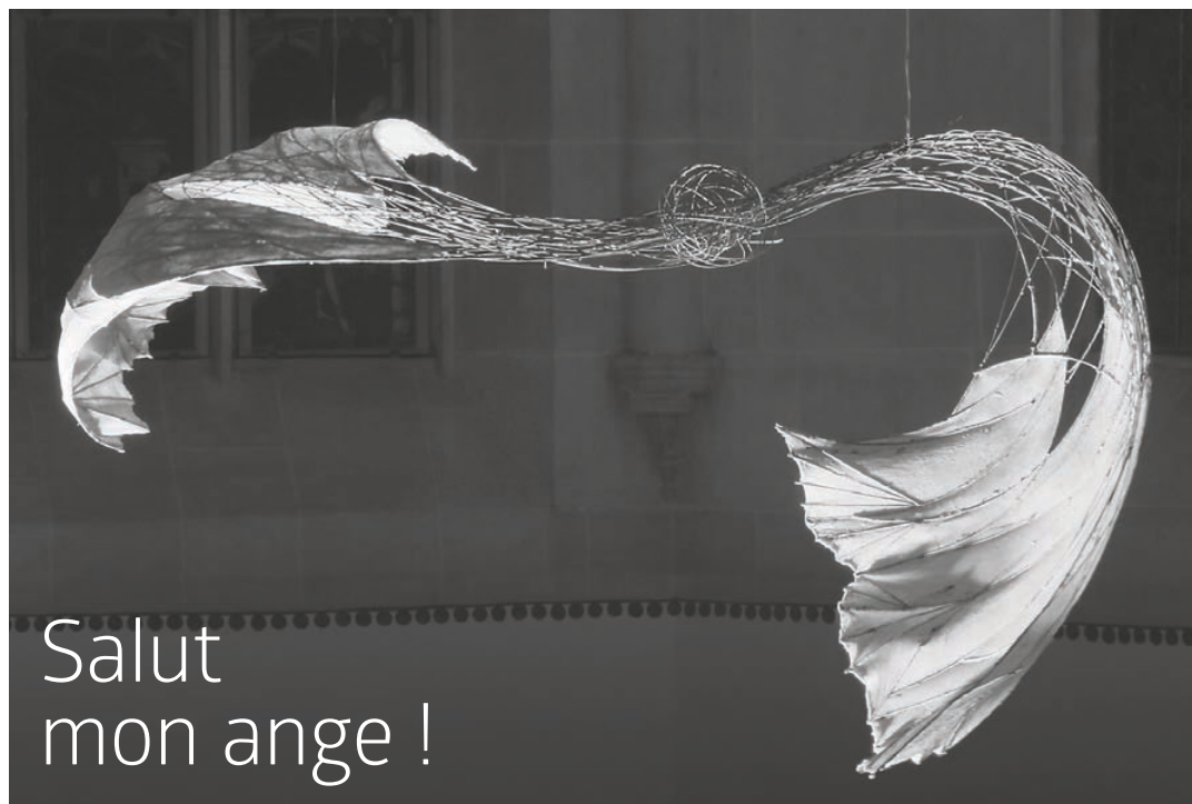
Sculpture de Erica Pedretti, Temple allemand.

JOURNAL DE LA PAROISSE RÉFORMÉE DE BIENNE