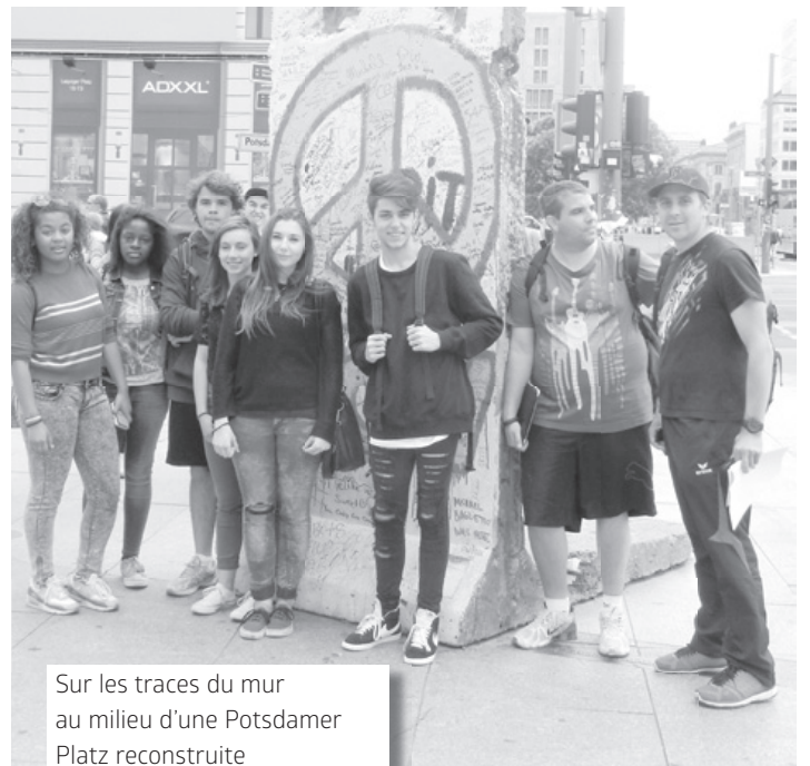
Sur les traces du mur au milieu d'une Potsdamer Platz reconstruite