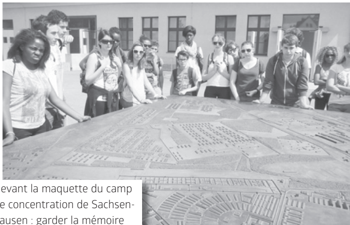
Devant la maquette du camp de concentration de Sachsenhausen : garder la mémoire

Comme chaque année depuis 16 ans, les catéchumènes vivent à Berlin un camp de confirmation riche en émotions. A l'image de l'histoire de la ville, ils expérimentent le fait que Dieu désire donner à chacun une seconde chance, d'amour, de partage et de renouveau, de la place pour des signes de paix dans notre monde.