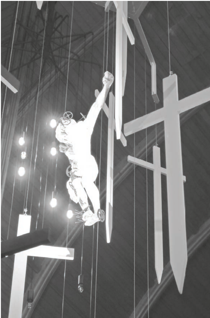
« Vers la lumière », installation de Grégoire Dufaux pour la Passion et Pâques. Exposition Présences 2013

JOURNAL DE LA PAROISSE RÉFORMÉE DE BIENNE