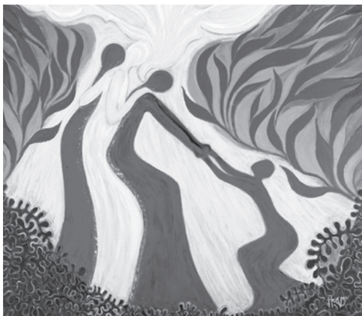
Illustration de la liturgie des femmes de Malaisie

Un chaleureux Merci à tous les bénévoles de la Fête de l'Entraide.