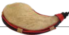
Carmelo Catalfamo Pasteur