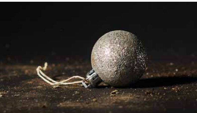
Une boule de Noël, un chapeau en cuir, autant d'étranges objets retrouvés par les bénévoles de Summit Foundation.

Tous ces objets témoignent de la pression humaine exercée notamment par nos activités de loisirs sur l'environnement alpin. Et de la nécessité de prendre des égards face à ce tableau vivant au paysage époustouflant qui s'offre à nous.