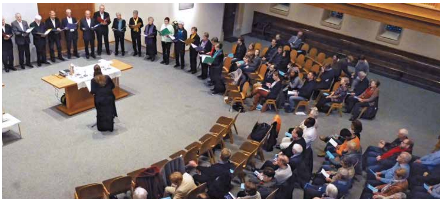
Les grains de seigle de la Chapelle de la Réconciliation de Berlin pour le pain de la Cène et l'harmonie des chants du Chœur de paroisse lors du culte de la Réformation du 6 novembre.

Contact : Ellen Pagnamenta, 078 657 02 31