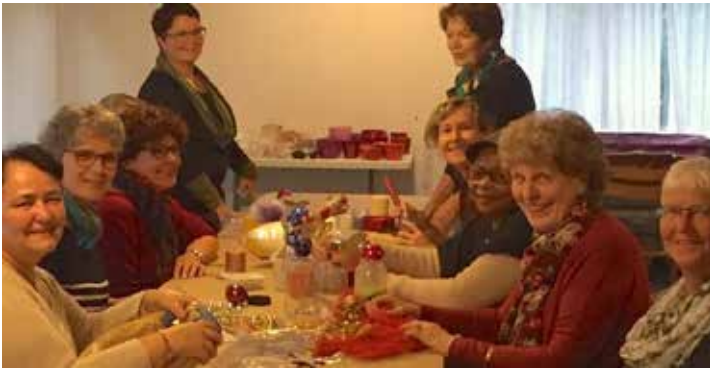
Les bénévoles de la vente de l'Avent en pleine activité!